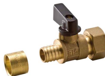
Figure 1 – Vanne à glissement RIQUIER