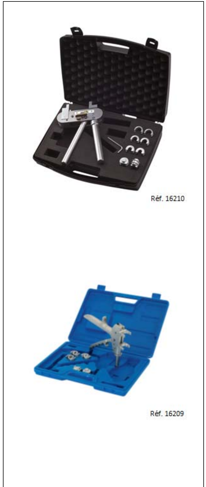
Figure 3 – Outillage d'assemblage